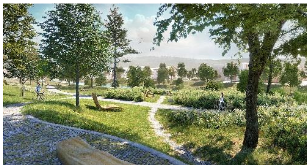
Koeber Landschaftsarchitektur GmbH

In derselben Sitzung votierte der Gemeinderat mit deutlicher Mehrheit, jedoch mit 13 Gegenstimmen, für die dauerhafte Sperrung der Mühlstraße für Autos. Ausgenommen von der Sperrung sind Busse, Taxis und der Lieferverkehr. Für den Radverkehr soll eine Abbiegemöglichkeit von der Mühlstraße in die Gartenstraße eingerichtet werden. Der bestehende Radstreifen auf der Neckarbrücke und vorderen Wilhelmstraße soll auch bleiben. https://www.tuebingen.de/gemeinderat/vo0050.php?kvonr=16916