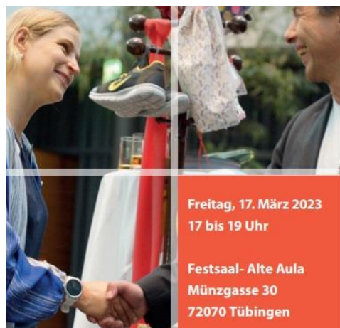
Grafik: Universitätsstadt Tübingen

https://worldcitizen.school/event/marktplatz-fuer-gute-geschaefte/