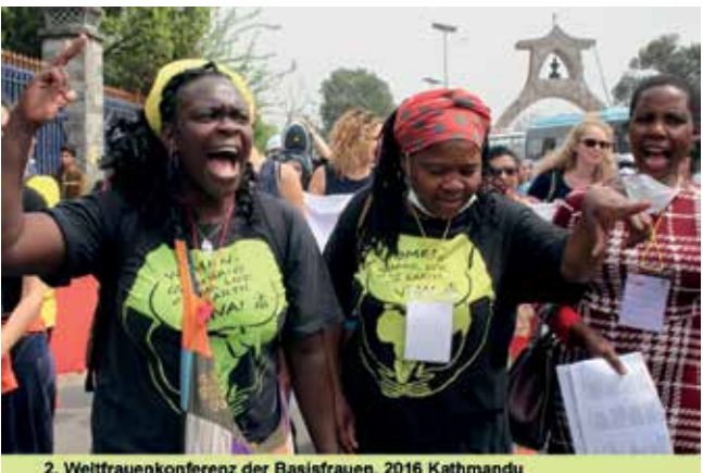
2. Weltfrauenkonferenz der Basisfrauen, 2016 Kathmandu

Beteiligt Euch an der Vorbereitung, fahrt mit nach Tunis.