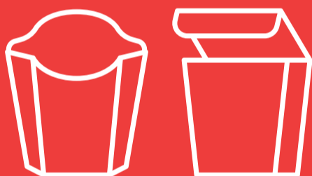
Boxen für z. B. Pommes, Nudeln, ...