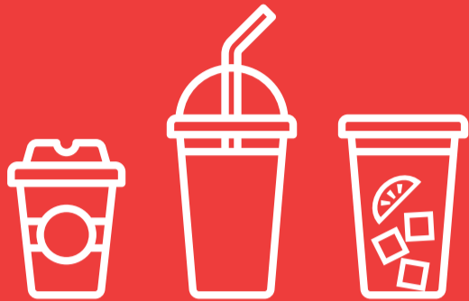
Getränkebecher für warme und kalte Getränke z. B. Kaffee, Tee, Cocktails, ...