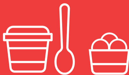
Becher für z. B. Müsli, Eis, Obst, ...