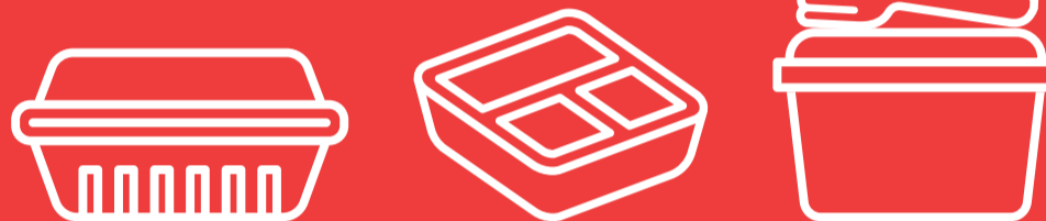
Schalen mit und ohne Deckel für z. B. Döner, Bowls, Salate, Sushi ...