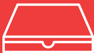
Kartons für z. B. Pizza, Pide, ...