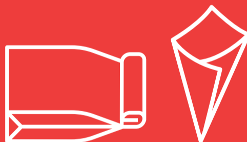
Tüten für z. B. Burger, Pommes, ...