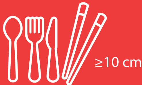
Besteck (Messer, Gabel, Löffel, Esstäbchen) ab einer Größe von 10 cm