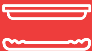
Teller für z. B. Pizzastück, ...