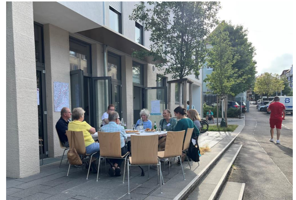
Beispiel Quartiersmanagement Stuttgart-Gablenberg „Zusammen in Gablenberg“