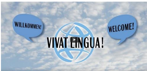
Screenshot Vivat Lingua! Video