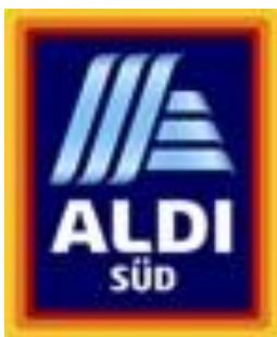
Logo: Aldo Süd