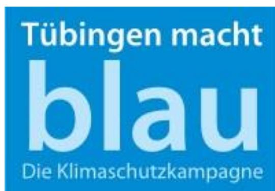
Logo: Tübingen macht blau