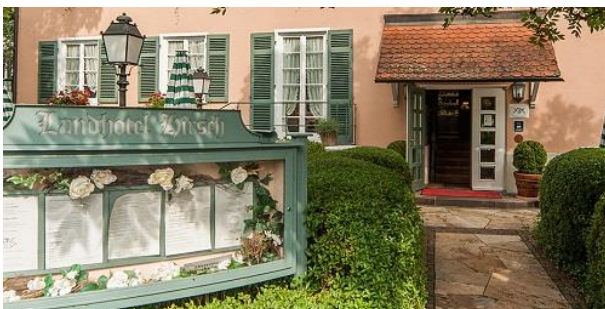
Bildausschnitt: Hirsch Bebenhausen