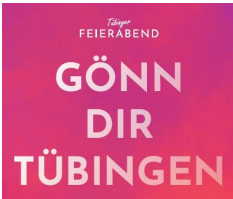
Grafik: Tübinger Feierabend

Der vorläufige Abschlussbericht zum Tübinger Modellversuch „Öffnen mit Sicherheit“ wurde am 11. Mai dem Sozialministerium übergeben. Der Bericht bescheinigt eine weitgehende wirtschaftliche Tragfähigkeit des Modells. So verzeichnete etwa die Außengastronomie bei schönem Frühlingswetter mit Tagestouristen hervorragende Umsätze. Mit einer Plakataktion in den Schaufenstern haben sich Betriebe des Handels, Gewerbes und der Gastronomie bei den Initiatoren des Tübinger Modellprojekts bedankt. https://www.tuebingen.de/modellversuch