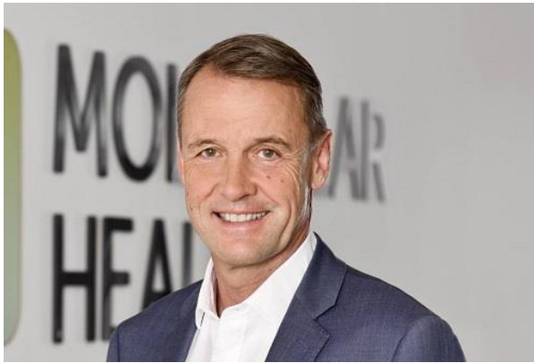
Friedrich von Bohlen und Halbach