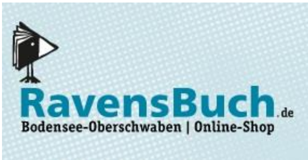
Logo: RavensBuch GmbH