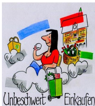
Bild: Unbeschwert einkaufen