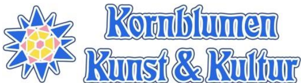
Logo: Kornblumen – Kunst & Kultur