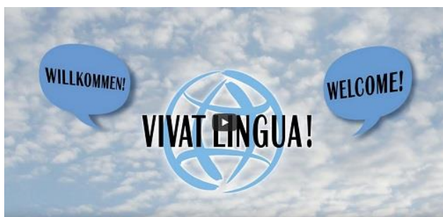
Screenshot Vivat Lingua! Video