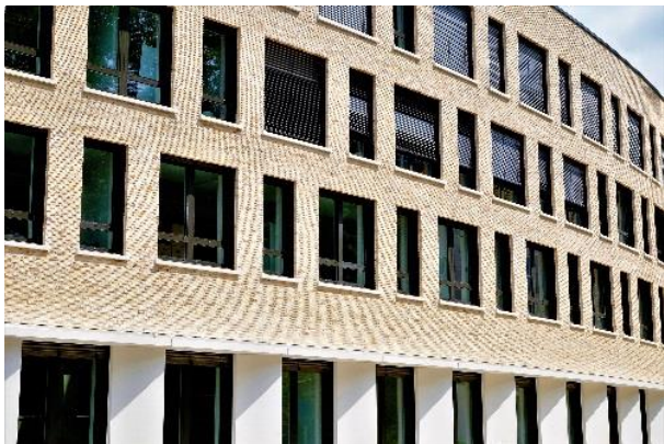
Technisches Rathaus