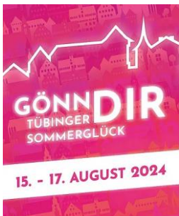
Bild: Gönn dir