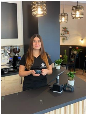
Standort