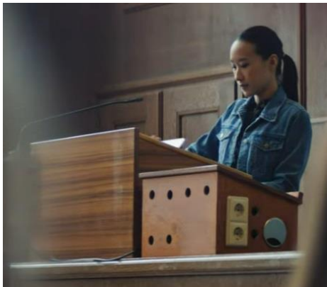
Screenshot: Werbefilm Uni Tübingen