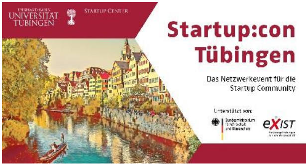
Grafik: Universität Tübingen