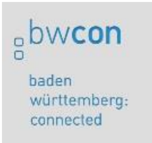
Logo: bwcon GmbH