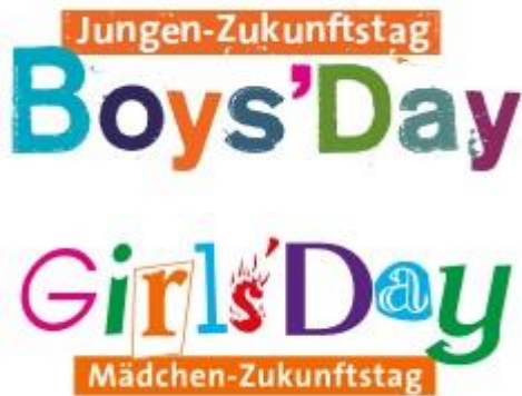
Logos: Boys' Day / Girls' Day