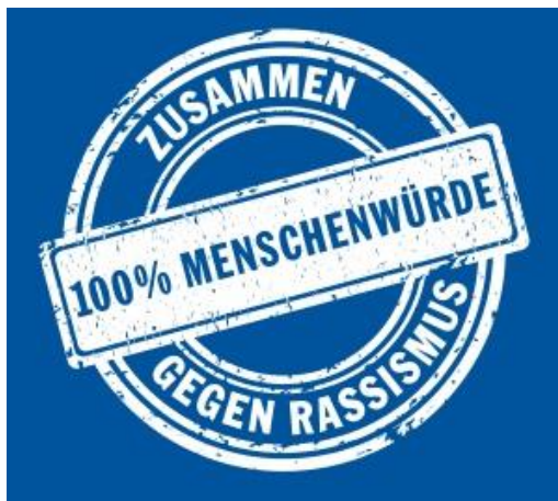
Logo: Stiftung gegen Rassismus