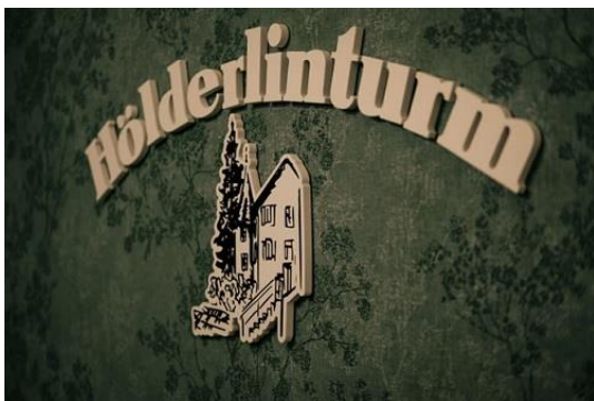
Bild: Restaurant Hölderlinturm