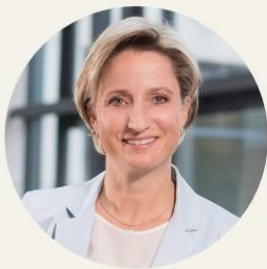
Dr. Nicole Hoffmeister-Kraut

Ministerin für Wirtschaft, Arbeit und Wohnungsbau