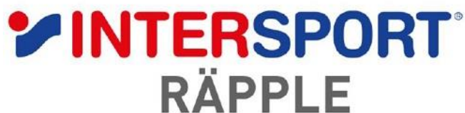
Logo: Intersport Rápplé