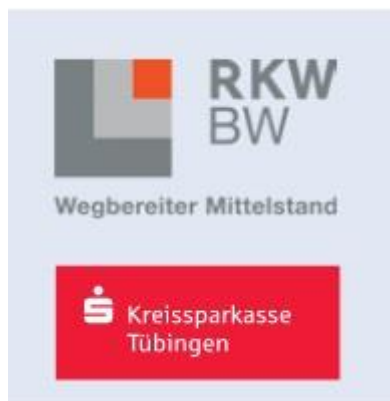
Logos: RKW BW / KSK Tübingen