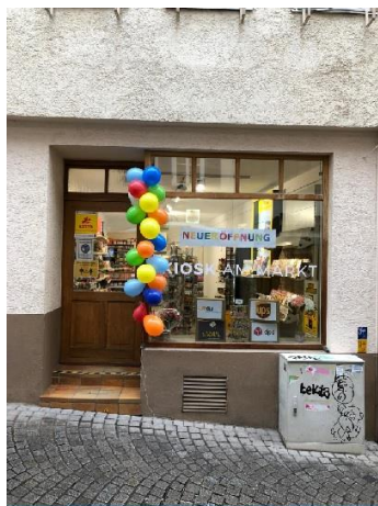
Bild: Kiosk am Markt