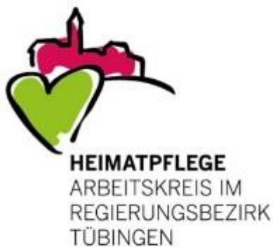
Logo: Arbeitskreis Heimatpflege

Dorfgasthäuser sind ein wichtiger Bestandteil unserer lebendigen Heimat. Um ihre Bedeutung für das Gemeinwesen in das öffentliche Bewusstsein zu rücken, schreibt der Arbeitskreis Heimatpflege im Regierungsbezirk Tübingen e.V. den Wettbewerb „Vorbildliches Dorfgasthaus“ aus. Ziel ist es, Dorfgasthäuser im Regierungsbezirk als lebendige Begegnungsstätte auszuzeichnen. Bewerbungen nimmt die Geschäftsstelle des Arbeitskreises bis zum 25. Juli entgegen. https://rp.baden-wuerttemberg.de/fileadmin/RP-Internet/Tuebingen/ DocumentLibraries/PresseAnhang_neu/23-05-30_Ausschreibungstext_2023.pdf