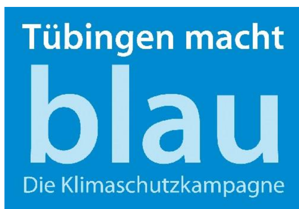
Logo: Tübingen macht blau