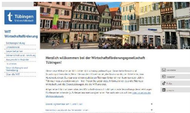
Bild: Vorschau auf die neue Webseite