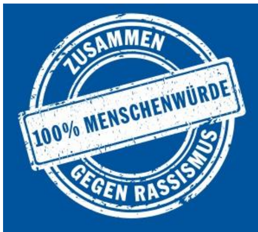
Logo: Stiftung gegen Rassismus