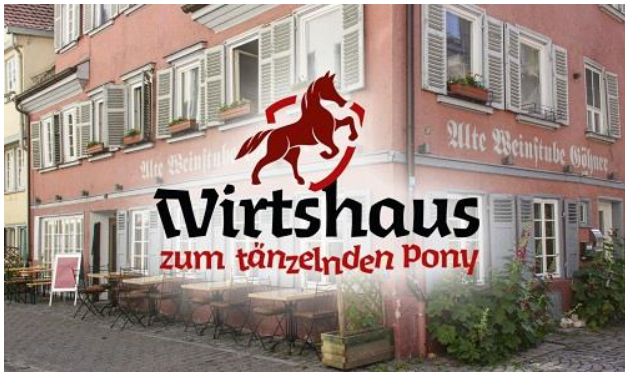
Bild: Wirtshaus zum tänzelnden Pony