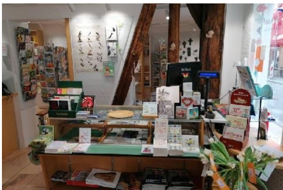
Bild: Buchhandlung Wekenmann