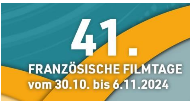
Bild: Französische Filmtage

https://www.tuebingen-info.de/de/veranstaltungen#/