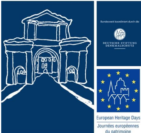
Grafik: Universitätsstadt Tübingen