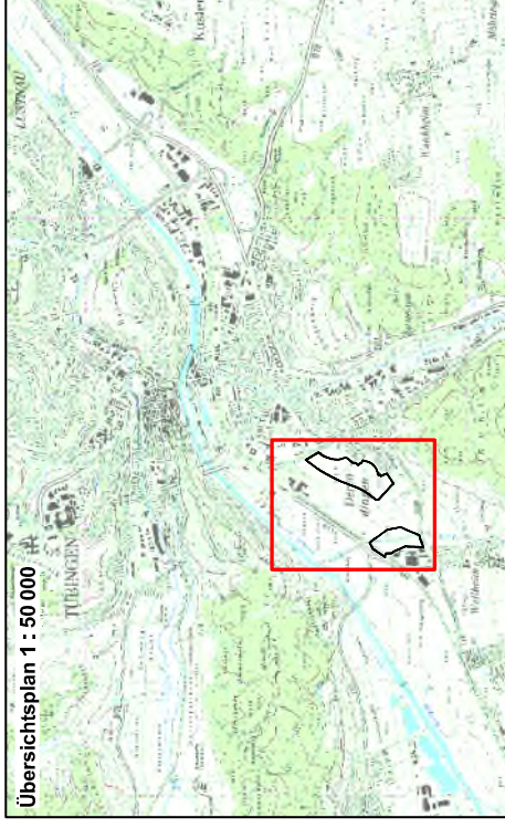
Übersichtsplan 1 : 50 000