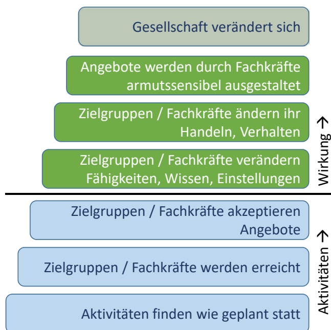
Eigene Darstellung. Vgl. Rostock 2020