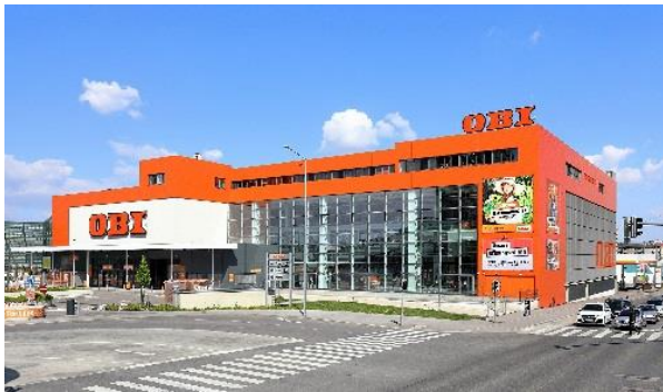
OBI-Markt in Wien.