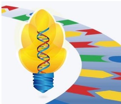
Grafik: BIO Deutschland e. V.

Baden-württembergische Unternehmen mit maximal 500 Vollbeschäftigten können sich jetzt noch schnell für den Lea-Mittelstandspreis für soziale Verantwortung in Baden-Württemberg bewerben. Voraussetzung ist eine Kooperation mit einer gemeinnützigen Organisation, zum Beispiel einem Verein, einer Schule oder einer sozialen Einrichtung. Weitere Informationen zum Wettbewerb und dem Bewerbungsverfahren unter https://www.lea-mittelstandspreis.de/lea-bw/home