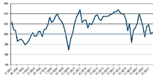
Grafik: IHK Reutlingen