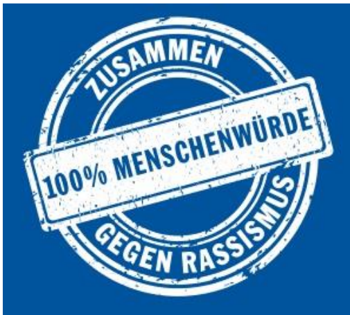
Logo: Stiftung gegen Rassismus