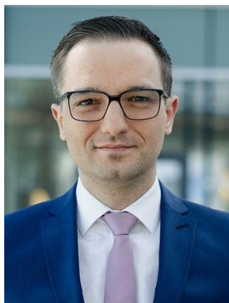
B. Strasser; Bild: Deutscher Bundestag