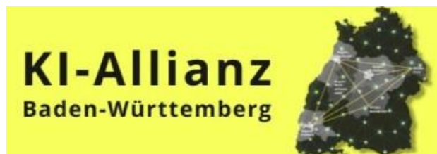
Logo: KI Allianz Baden-Württemberg