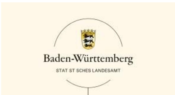
Logo: Statistisches Landesamt

https://stiftung-gegen-rassismus.de/iwgr