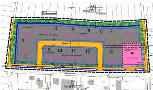
Planausschnitt: Universitätsstadt Tübingen