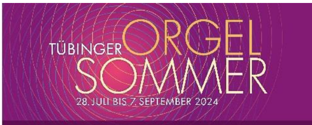
Bild: Stiftskirche Tübingen

https://www.tuebingen.de/kennen-sie-tuebingen