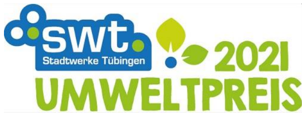
Logo: swt Umweltpreis