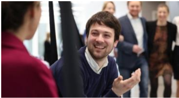
S. Gansloser; Bild: Wirtschaftsjuvenen