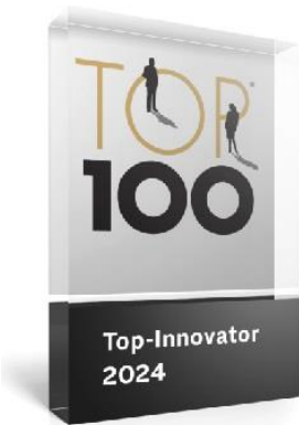
Bild: Top-Innovator 2024