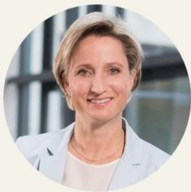
Dr. Nicole Hoffmeister-Kraut

Ministerin für Wirtschaft, Arbeit und Wohnungsbau