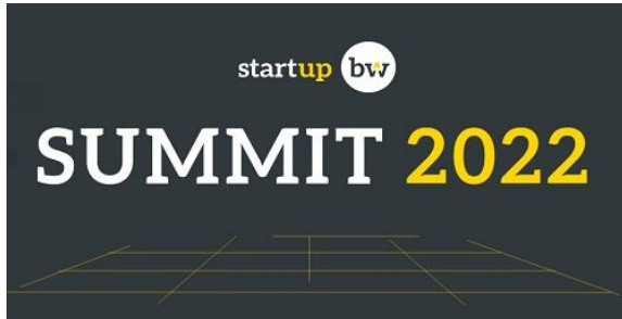
Bild: Start-up BW Summit 2022

Mehr als 20 Startups aus den medizinischen Life Sciences wurden bislang mit dem 4C Accelerator Tübingen und dem für die Rudolf-Diesel-Medaille nominierten Förderkonzept erfolgreich unterstützt – und es soll weitergehen! Gefördert wird das Programm durch die Kampagne „Start-Up BW“ des Wirtschaftsministeriums Baden-Württemberg, der Stiftung für Medizin-Innovationen und der B. Braun Stiftung. Bewerbungsschluss ist am 22. Juli. https://mi-incubator.com/en/4c-accelerator-tuebingen/?utm_medium=Mailing&utm_campaign=Announcement+4C+Q1-22