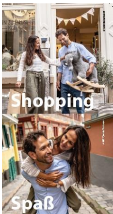
Bild: Ausschnitt der Anzeige