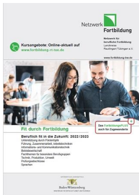
Grafik: Netzwerk Fortbildung