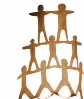
Grafik: Universitätsstadt Tübingen