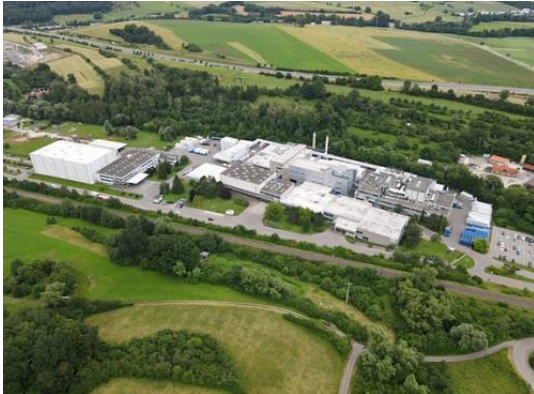
CHT-Werk Dußlingen

Als Ausbildungsbetrieb bereiten die Stadtwerke Tübingen (swt) junge Menschen auf den Einstieg ins Berufsleben vor. Mit Erfolg: Der regionale Energieversorger wurde im Juni erneut mit dem Ausbildungssiegel „BEST PLACE TO LEARN“ ausgezeichnet. Mit der Gesamtnote „sehr gut“ übertreffen die swt das gute Ergebnis der ersten Zertifizierung von vor drei Jahren. Auch in Zukunft wollen die swt weiter in die Qualität ihrer Ausbildung investieren. https://www.swtue.de/