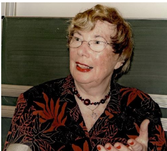
Felicia Langer

https://www.tfrt.de/die-tfrt/unsere-aktivitaeten/