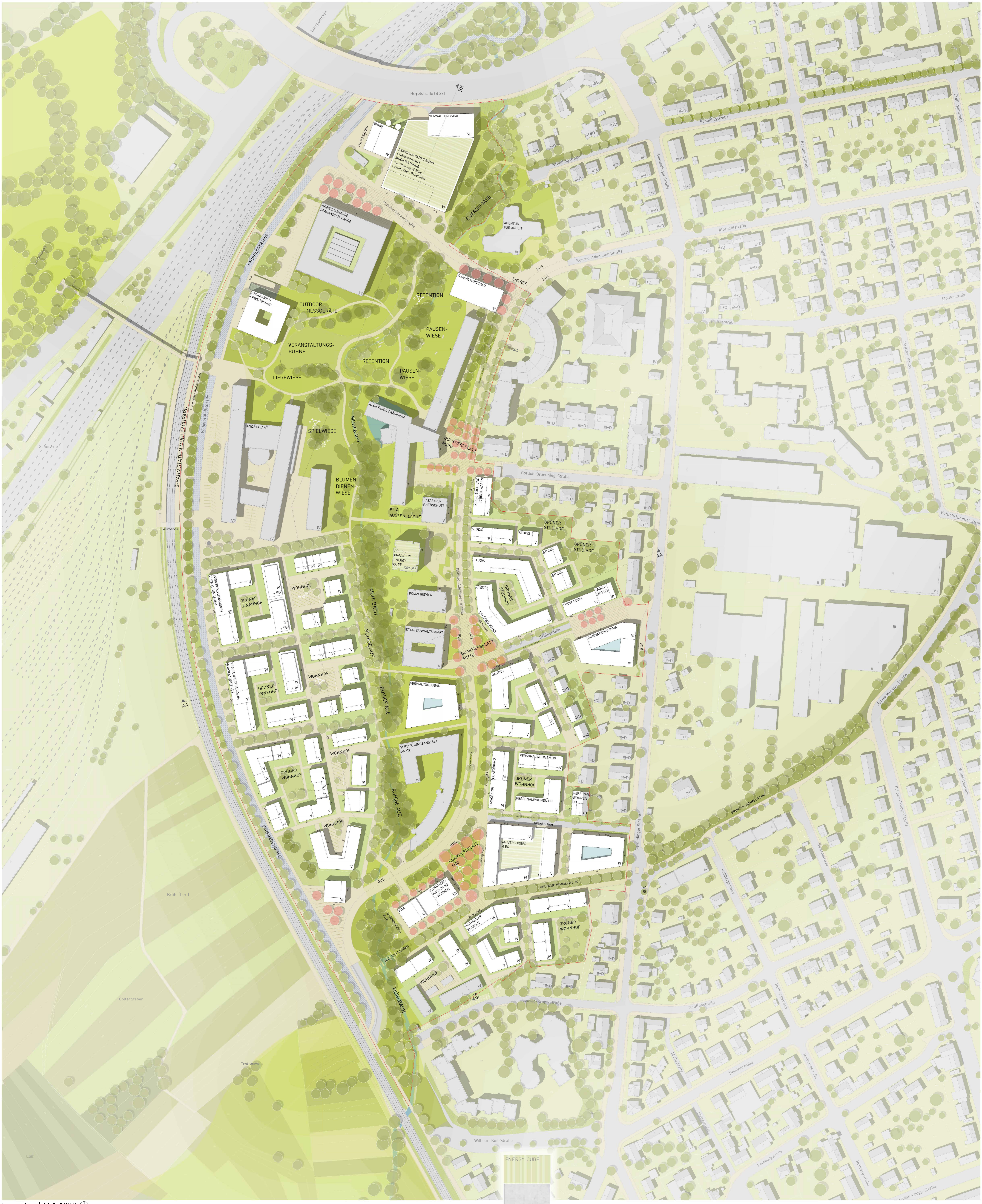
Lageplan | M 1:1000