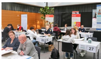
Bild: Azubi- Speeddating