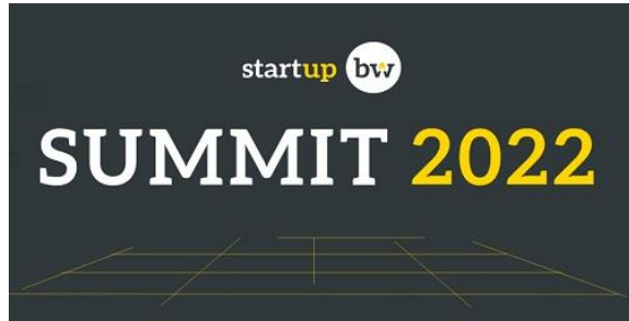
Bild: Start-up BW Summit 2022