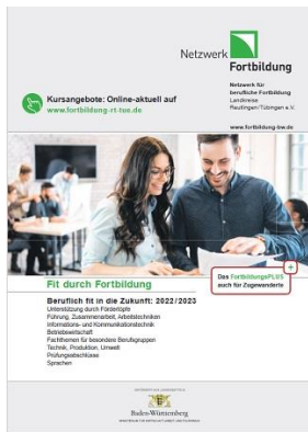
Grafik: Netzwerk Fortbildung