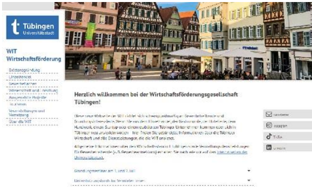
Bild: Vorschau auf die neue Webseite