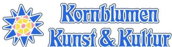
Logo: Kornblumen – Kunst & Kultur