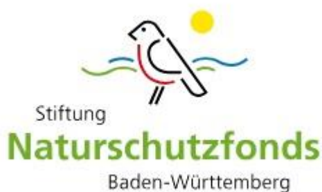
Logo: Stiftung Naturschutzfonds BaWü

Unter dem Motto „Wir fördern Vielfalt“ bezuschusst die Stiftung Naturschutzfonds Naturschutzprojekte in Baden-Württemberg mit insgesamt 1,4 Millionen Euro. Unternehmen können Anträge laufend oder bis zum 2. November einreichen. Das Förderspektrum der Stiftung ist weit gefasst: Angewandte Forschung im Naturschutz, umsetzungsorientierte naturbasierte Strategien zur Anpassung an den Klimawandel oder Bildung für nachhaltige Entwicklung zur Förderung von Naturschutz. https://stiftung-naturschutz-bw.de/