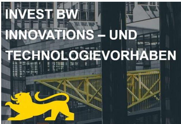
Grafik: Wirtschaftsministerium BW