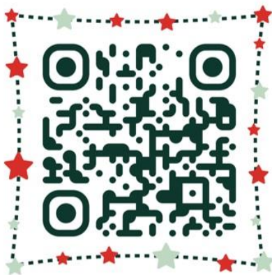
Grafik: Universitätsklinikum Tübingen

Sie sind berufstätig, und Gesundheit am Arbeitsplatz liegt Ihnen am Herzen? Teilen Sie Ihre Erfahrungen und Perspektiven mit Forschenden und melden Sie sich jetzt zur ersten Bürger_innenkonferenz des Instituts für Arbeitsmedizin, Sozialmedizin und Versorgungsfor-schung des Universitätsklinikums Tübingen an. Die kostenlose Veranstaltung findet am 18. September von 18 bis 21 Uhr im Innovationszentrum Westspitze (Eisenbahnstraße 1) statt. https://www.medizin.uni-tuebingen.de/go/buergerinnenkonferenz