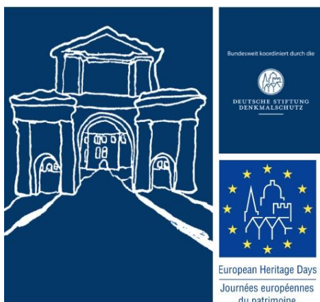
Grafik: Universitätsstadt Tübingen