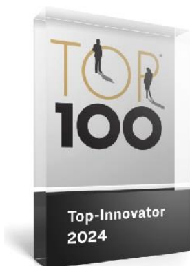
Bild: Top-Innovator 2024