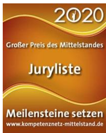
Bild: Großer Preis des Mittelstandes