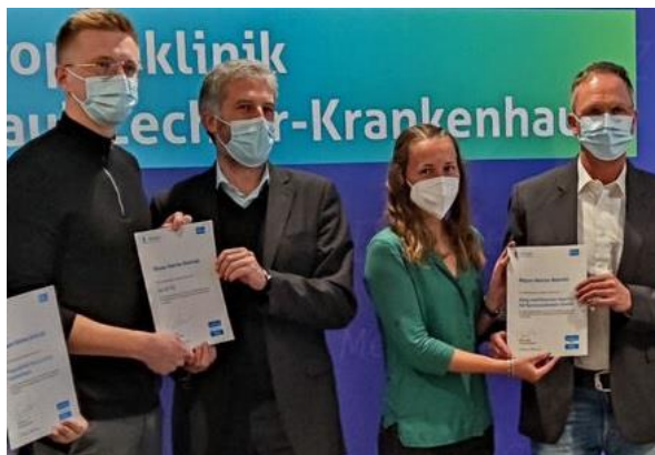
Archivbild: Universitätsstadt Tübingen