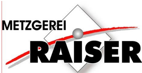
Logo: Metzgerei Raiser