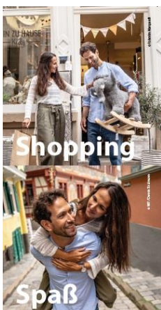
Bild: Ausschnitt der Anzeige