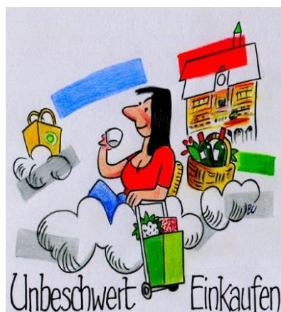
Bild: Unbeschwert einkaufen

Um das Einkaufen in der Stadt attraktiver zu machen, hat die Initiative „Unbeschwert einkaufen“ einen Designwettbewerb für Einkaufstrolleys ausgelobt (wir berichteten). Die drei von einer Jury prämierten Trolley-Entwürfe und Prototypen werden am 7. Juli ab 17.30 Uhr auf dem Platz vor dem Stadtmuseum vorgestellt und erläutert. „Unbeschwert einkaufen“ ist aus der der Genossenschaft des Löwen-Ladens hervorgegangen und gehört zu den Projekten zur Stärkung des städtischen Handels, die von der WIT gefördert werden. einkaufshelfer@loewen-laden.de