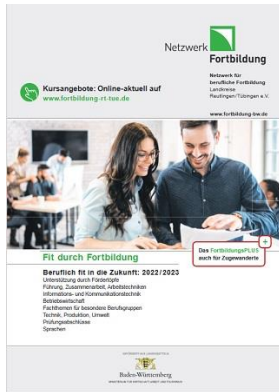
Grafik: Netzwerk Fortbildung