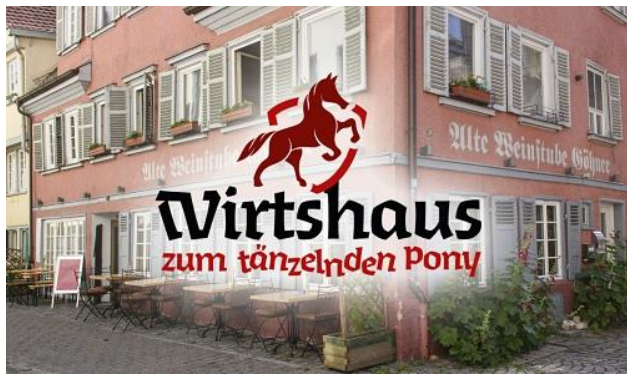
Bild: Wirtshaus zum tänzelnden Pony