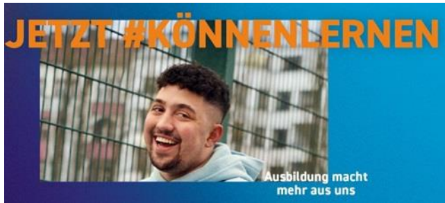
Grafik: jetzt #könnenlernen