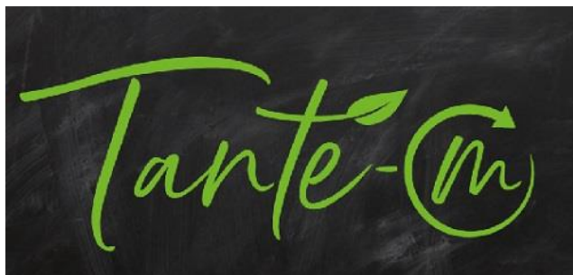
Logo: Tante M