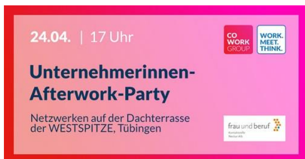
Grafik: Cowork Group/ Kontaktstelle Frau und Beruf

https://www.iwm-tuebingen.de/mai-conference