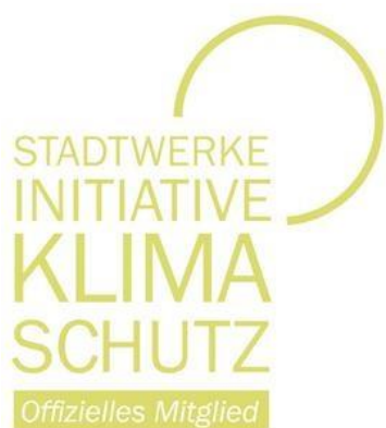
Grafik: Stadtwerke-Initiative Klimaschutz

Am 8. März besuchte der Bundesminister für Ernährung und Landwirtschaft Cem Özdemir das Holzbau-Startup TRIQBRIQ AG in der August-Bebel-Straße. Hintergrund war die Bescheidübergabe einer Startup-Förderung der Landwirtschaftlichen Rentenbank in Höhe von 800.000 Euro. TRIQBRIQ fertigt standardisierte Holzbausteine aus Schwach- und Schadh Holz ohne den Einsatz von künstlichen Verbindungsmitteln. Auch Baden-Württembergs Ministerpräsident Winfried Kretschmann war 2023 bereits zu Gast. https://triqbriq.de/