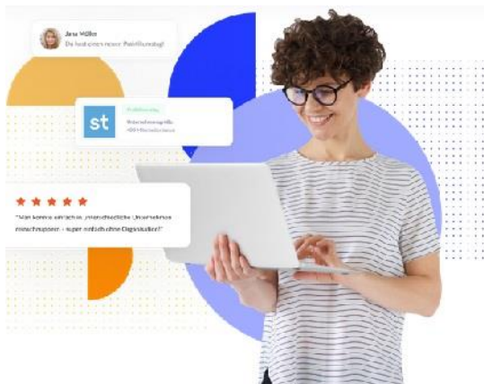
Bild: Praktikumswochen in Baden-Württemberg