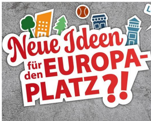
Grafik: Universitätsstadt Tübingen