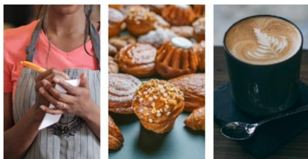
Bild: Café Mehrrettich

https://www.gartenbau.org/tuebingen/andreas-fritz-garten--u-landschaftsbau-aULBht