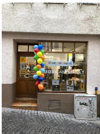
Bild: Kiosk am Markt